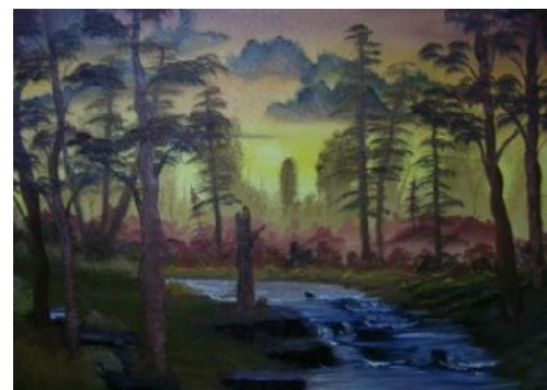
Abbildung 3: Natur in Bayern schützen.

Wir halten das aktuelle EEG und die Förderung von Solaranlagen nicht für sinnvoll, ebensowenig wie die über-intensive Nutzung bayerischer Böden für den Anbau von Raps.