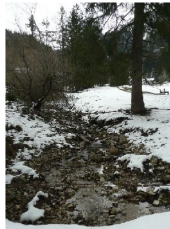
Abbildung 1: Unsere bayerische Natur – schützen und bewahren